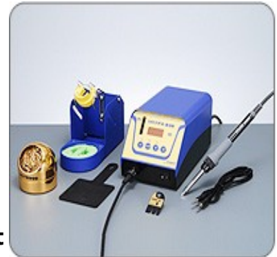
FX-838 Lödstationen med krut i. 4520kr/st

För en mer detaljerad beskrivning klicka här .