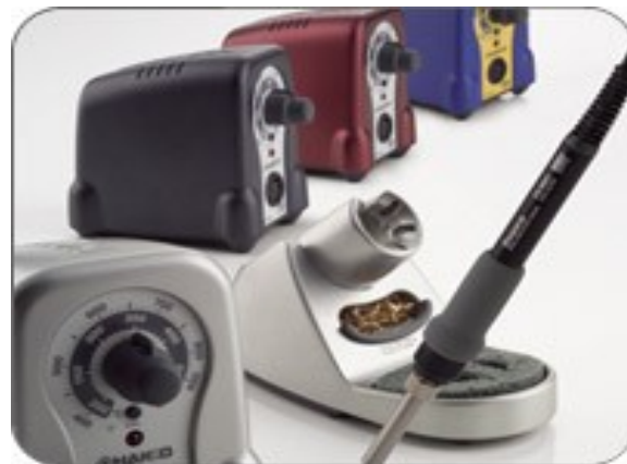
FX-888 Möjlig att få i fyra färger. 995kr/st

Nu kom den i fyra färger Svart, Silver, Metallic röd och den Blå/Gula varianten som idag är lite av Hakkos kännetecken.